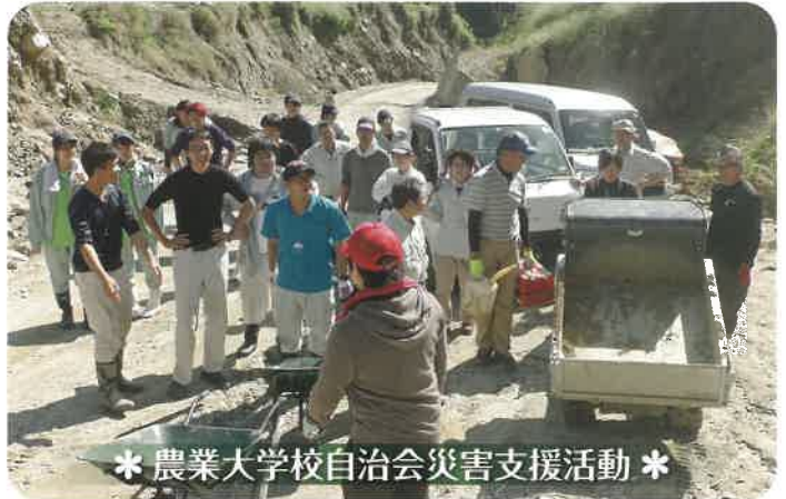
* 農業大学校自治会災害支援活動 *