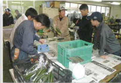
野菜の出荷調製(研修科野菜班)