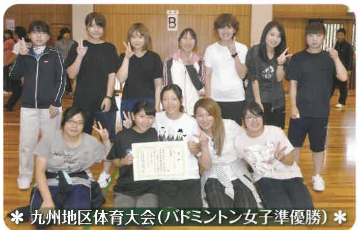
* 九州地区体育大会(バドミントン女子準優勝) *