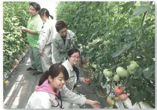
トマトの生育調査(野菜コース)

イチゴやナスなどの果菜類や露地野菜など、25品目以上を幅広く実習。トマト袋培地栽培やイチゴ高設栽培施設を有し、施設内環境データの活用による栽培管理やグローバルGAP取得に取り組む。