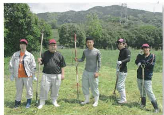
飼料作物収穫(畜産コース)

家畜との触れ合いを通して命の尊さを学ぶとともに、家畜の飼育方法は、隣接する農林業総合試験場畜産部で実習を通して学ぶ。さらに畜産経営に必要な様々なスキルを習得しながら、優しく責任感の強い学生を育成。