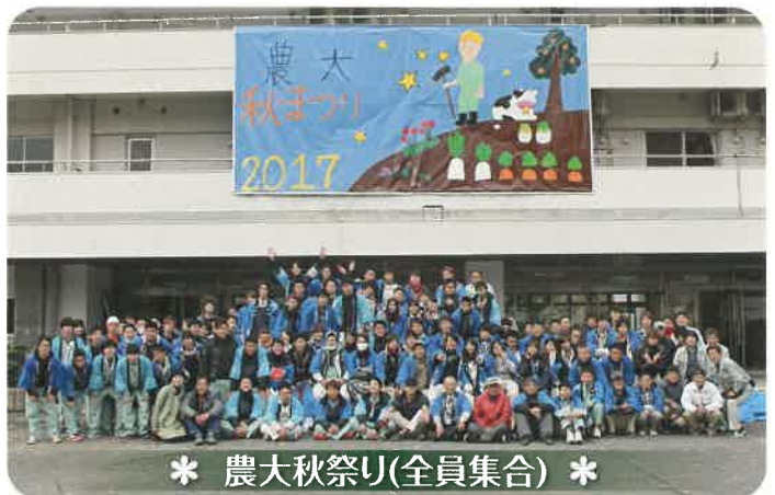
* 農大秋祭り(全員集合) *