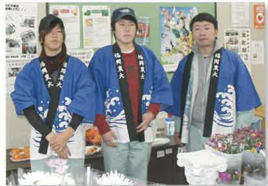
直売所販売実習(果樹コース)

甘いイチジク「とよみつひめ」、世界初無核の完全甘カキ「秋王」、大玉で果肉が黄色いキウイ「甘うい」、9月から収穫可能なミカン「早味かん」など農場長に就任した学生を中心に栽培実習。