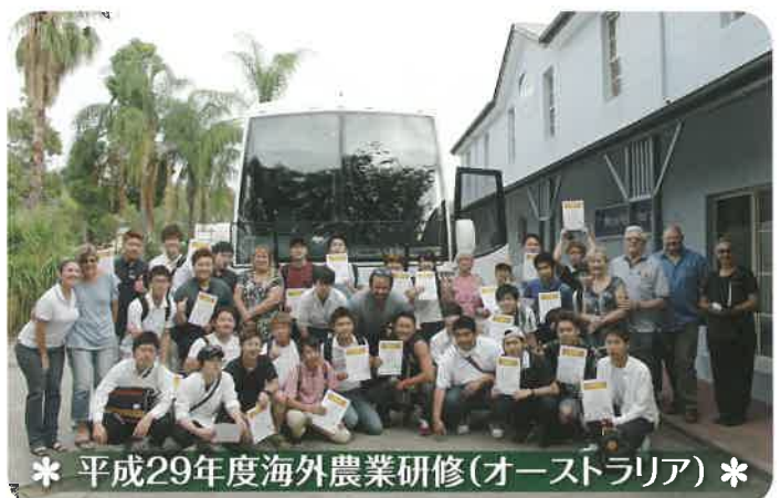
* 平成29年度海外農業研修(オーストラリア) *