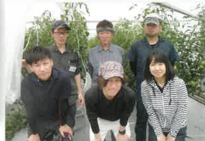
トマトハウスにて(研修科トマト班)