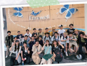
海外農業研修(オーストラリア)