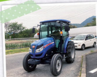
大特免許取得講習