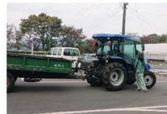
けん引運転免許講習