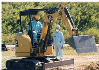
小型車両系建設機械講習