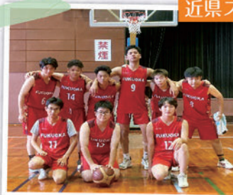
近県スポーツ大会