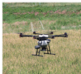
農業散布ドローン