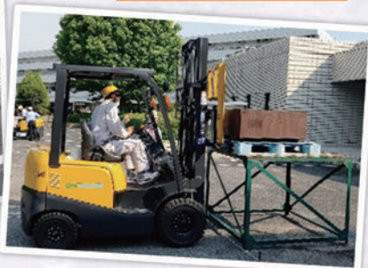
フォークリフト講習