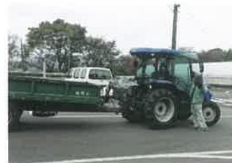
けん引運転免許講習