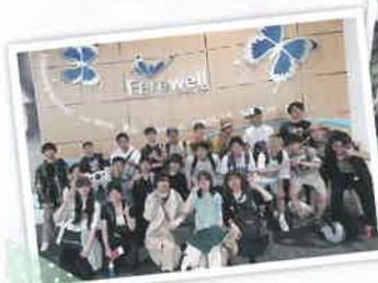
海外農業研修(オーストラリア)