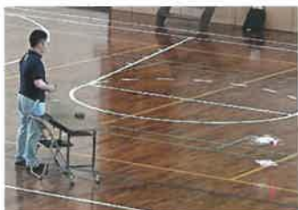
無人航空従事者試験3級・基礎技能講習