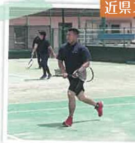
近県スポーツ大会