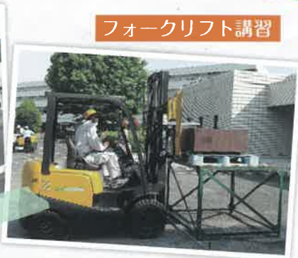
フォークリフト講習