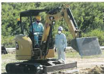
小型車両系建設機械講習