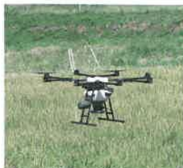
農業散布ドローン