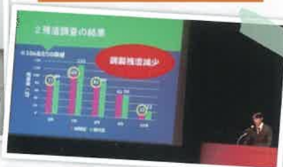
九州プロジェクト発表会