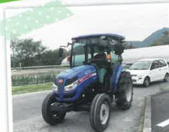
大特免許取得講習